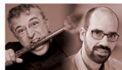
VICENÇ PRATS / JORDI TORRENT